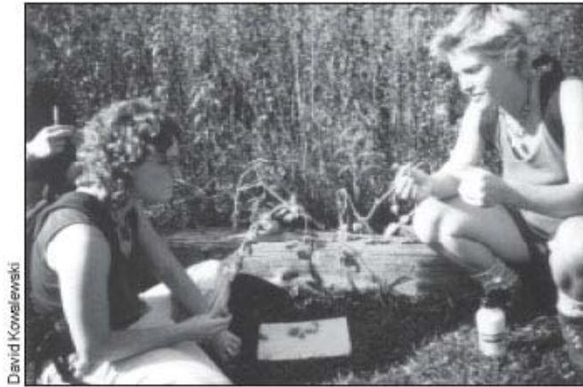
Los estudiantes examinan algunas cerezas de tierra (ground cherries en E.U.), también conocidas como "Uchuvas" en Colombia y "Aguaymanto" y "Capuli" en Perú.