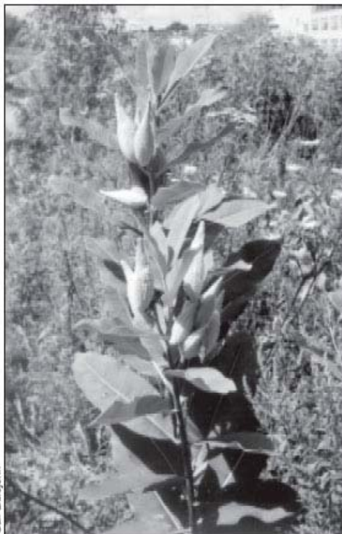
Una vez que la savia de las plantas de algodoncillo es evaporada, los tallos, capullos y vainas de las semillas se pueden cocinar y comer como verduras silvestres.

Probablemente debido a esta intensa inmersión, sólo un estudiante en todos los cursos recibió una calificación inferior al 90 por ciento requerido en el examen de toxicidad. Sin embargo, después de este examen, hablé de todos los errores que se