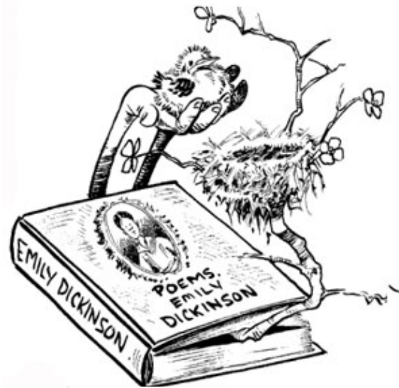
Poemas de Emily Dickinson

una señal de humo para el rescate, escribir mensajes grandes en la arena que puedan ser visibles por los aviones, asegurarse de que la gente está trabajando, mantener la relación de comunidad, facilitar reuniones y organizar eventos.