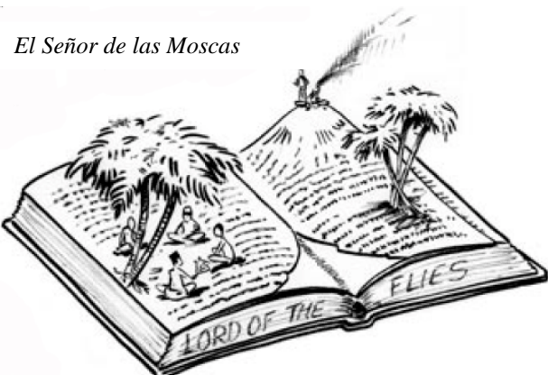
El Señor de las Moscas

Con trabajos como el de William Holding, “El Señor de las Moscas”, hay un buen número de formas para conectarse con los temas de justicia social. Un tema principal, así como el conflicto de la obra, es la civilización versus el salvajismo. Este tema explora la idea de que vivimos por dos impulsos como seres humanos: el instinto de vivir acorde a unas reglas, actuar pacíficamente, seguir mandatos morales y valorar el bienestar del grupo, en contra del instinto de satisfacer los deseos inmediatos, actuar violentamente para obtener supremacía sobre otros, e imponer la