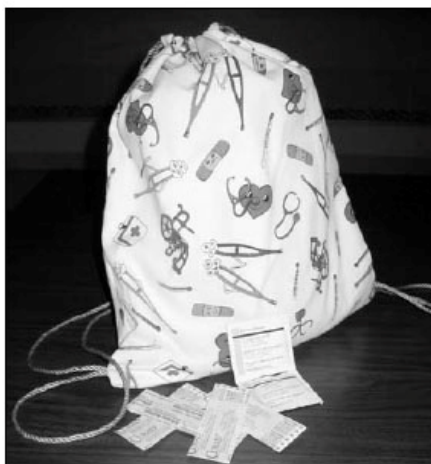
Mochila de primeros auxilios