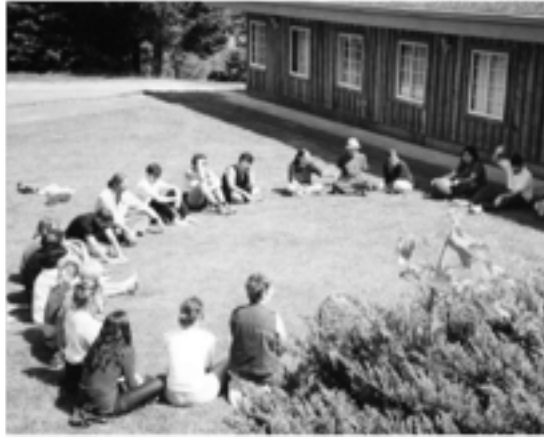
Fotografías por la Carta de la Tierra de Cowichan